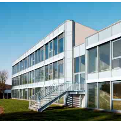
Алюминиевая дверная система Schüco ADS 75.SI Schüco Aluminium door system ADS 75.SI