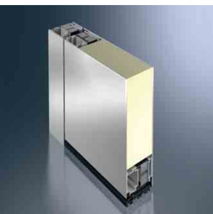
Дверная система Schüco ADS 75.SI Schüco door system ADS 75.SI

Высокотеплоизолированная дверь, которая отвечает повышенным требованиям по части энергопотребления и multifunctionality.